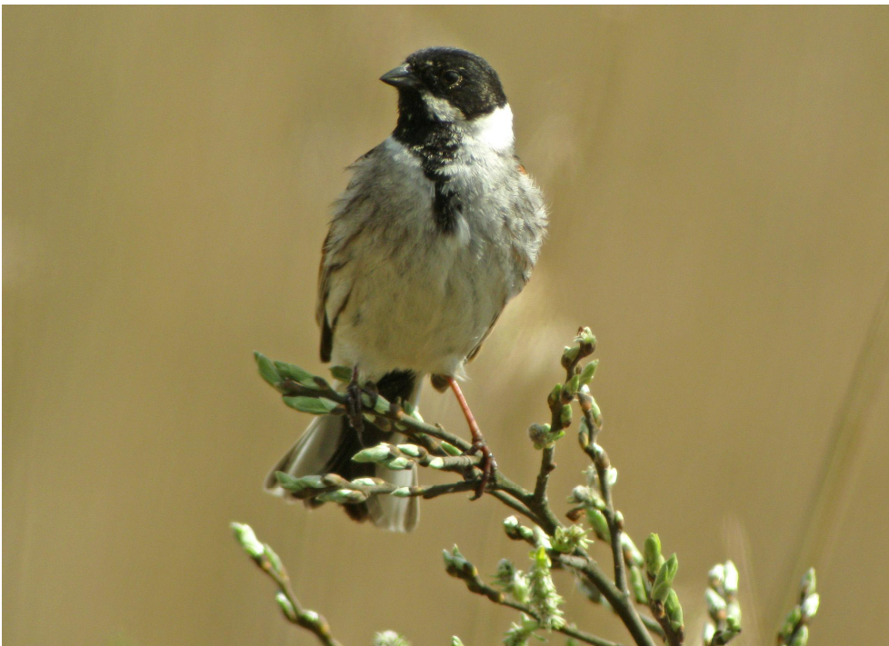
Gustavelundin tutkimusalueella oli neljä pajusirkkun reviiriä. Kuvassa koiras.