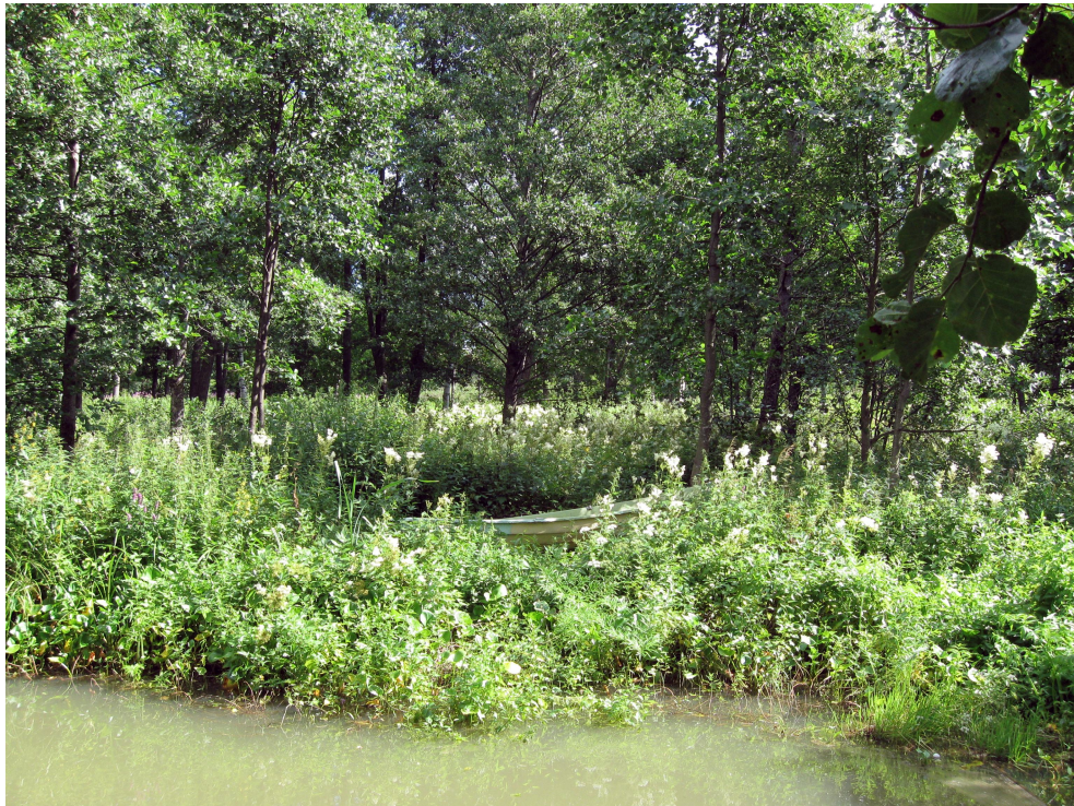
Näkymä kunnan venepoukamasta koilliseen tervaleppäluhdan suuntaan.