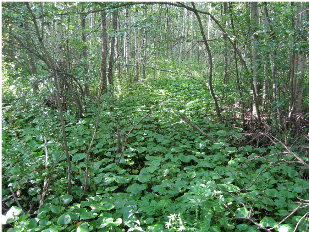
Näkymä kosteapohjaiselle rantaluhdalle. Luhta vaihettuu kuivemmillä paikoilla lehdoksi.

Kottaraisen pesiä oli tutkimusalueella yhteensä kuusi. Pesistä kolme sijaitsi opiston pihamaan isojen lehtipuiden koloissa. Yksi kottaraispesistä oli lehdossa vanhassa tikankolossa ja kaksi pesää oli tervaleppäluhdalla, tervaleppien koloissa.