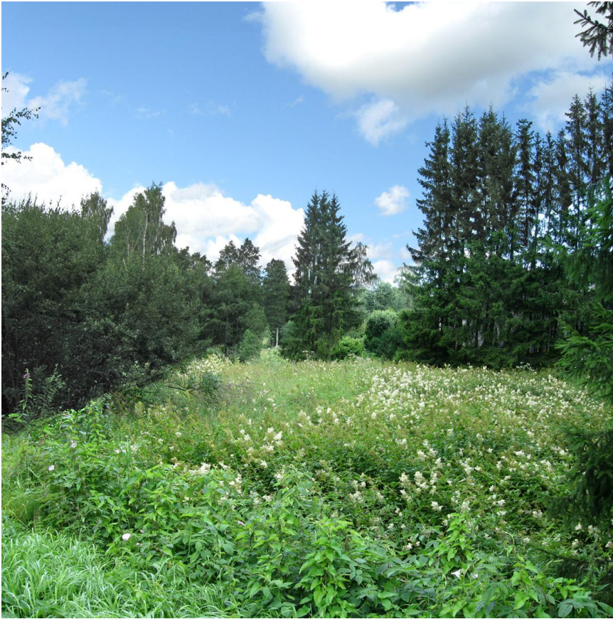
Näkymä kunnan venepoukamaan johtavan tien varresta koilliseen. Kuusten takana on pientaloja. Pensaikossa oli mm. luhta- ja viitakerttusen sekä viitasirkkalinnun reviirit.