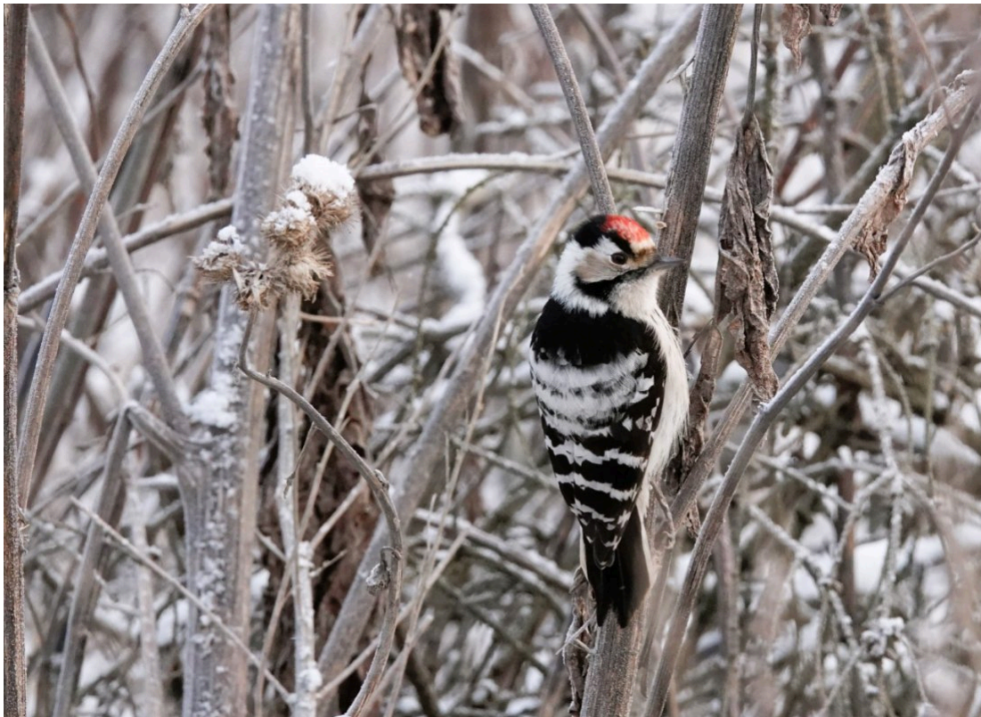
Pikkutikkakoiras Hyvinkään Kytäjällä